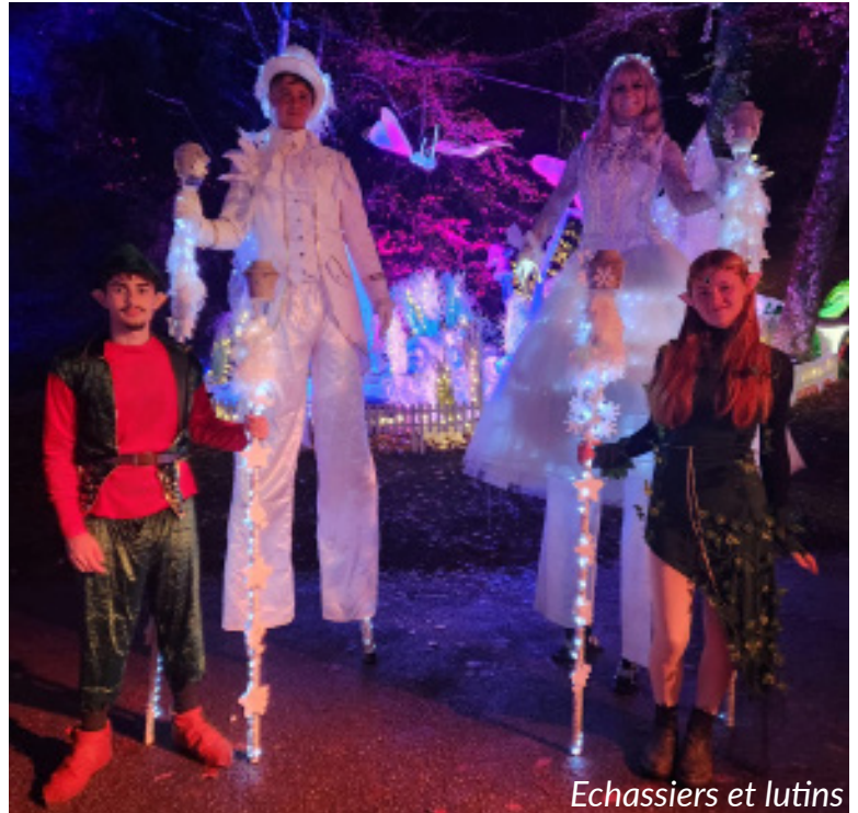
Echassiers et lutins

Situé sur le territoire de la commune de Pregny-Chambésy, ce domaine appartient à l'État de Genève et est entretenu par le Conservatoire et les Jardins botaniques de la Ville de Genève. Ouvert à tous, touristes, sportifs, promeneurs ou simples visiteurs, il constitue un lieu de détente très apprécié des Genevois, qui y sont profondément attachés.