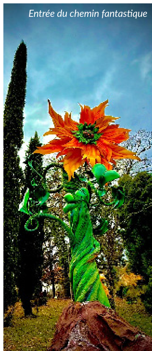
Entrée du chemin fantastique