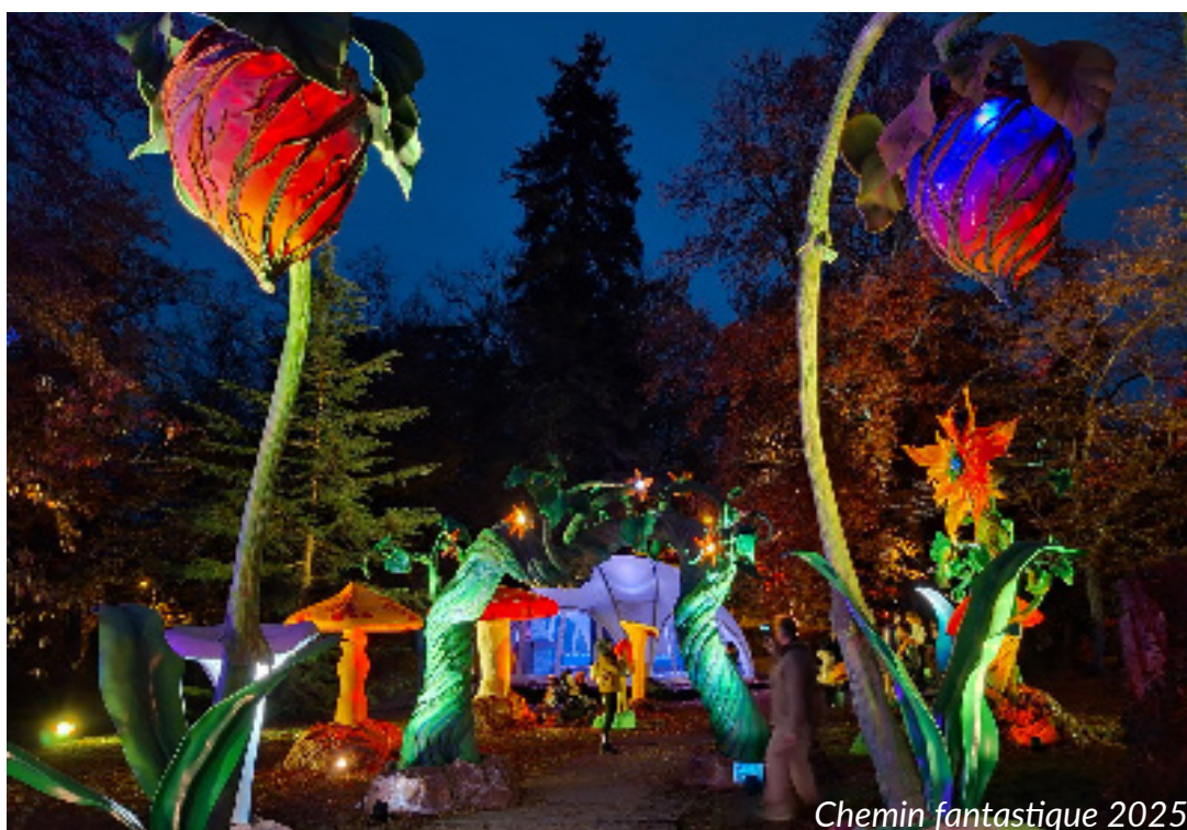
Chemin fantastique 2025

Toutes ces expériences font des Féeries de Penthes un évènement culturel à la fois festif, artistique et participatif, où chaque visiteur peut vivre un moment unique et mémorable.